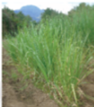
Jaribio la fungwe