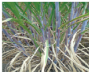
R 575: Mbegu ya miwa ina yotogoma a umwagi linaji