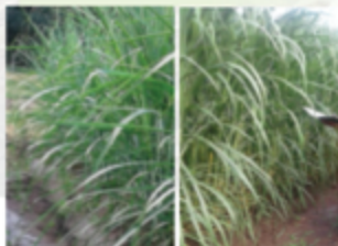
Hatua za awali kwa jaribio la mbegu za miwa